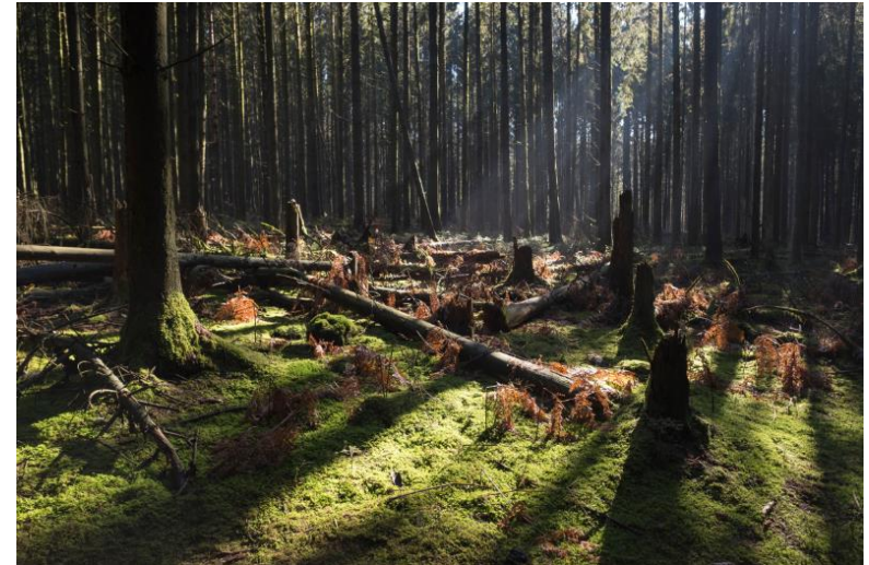
Deterioro y rotura localizada de píceas después de un problema de sanitario.